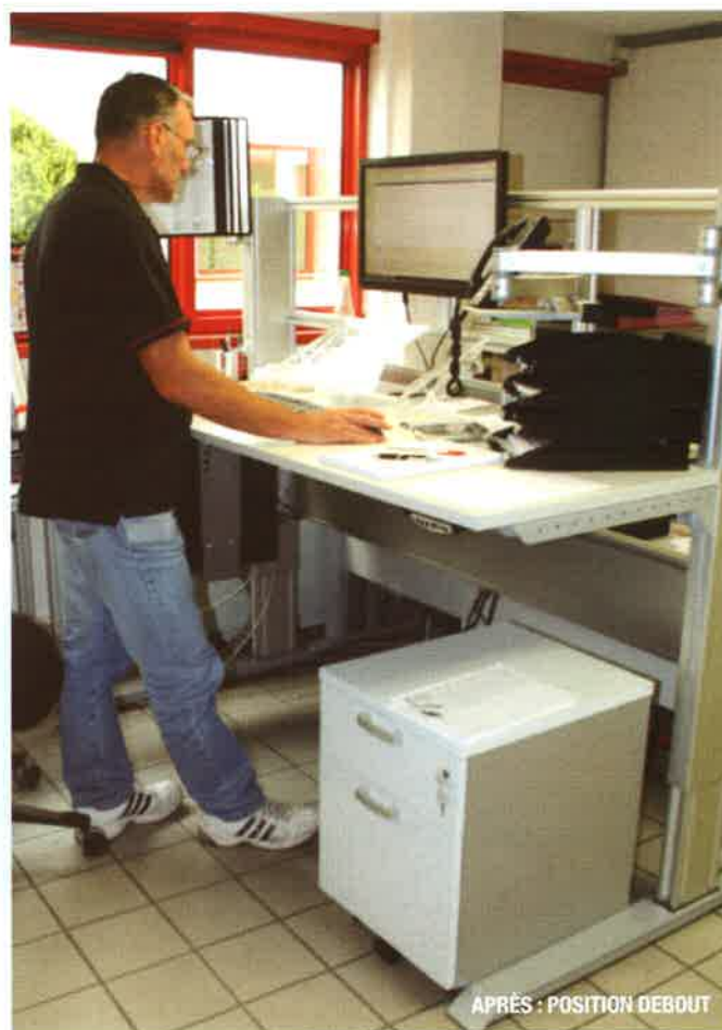
APRÈS : POSITION DEBOUT

Afin de préserver son poste, la direction décide d'appliquer rapidement les préceptes mis en place chez ses clients et lance l'aménagement de son poste de travail.